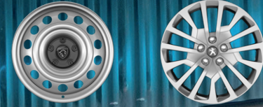
16" Jant Kapakları 17" Jant Kapakları