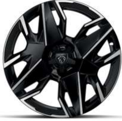
19" Elmas Kesim Jantlar BREDA

Allure & GT (Hybrid) versiyonlarında standart