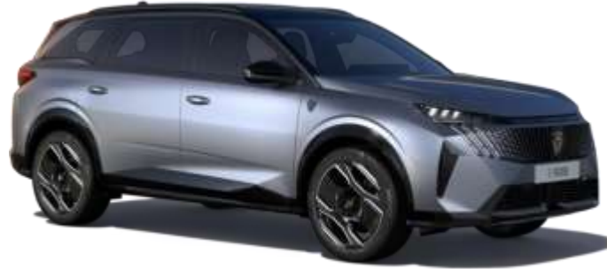
Tekno Gri F4M0