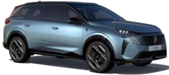
İngaro Mavi 7KM0