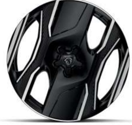
20" Elmas Kesim Jantlar SOFIA