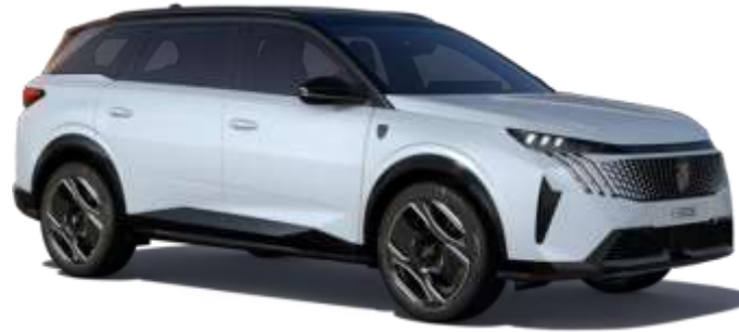
Okenit Beyaz SUM0