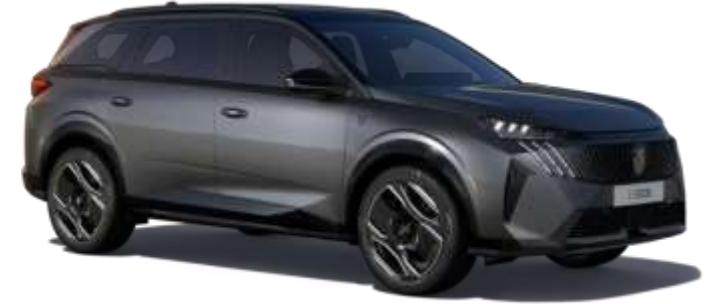
Titan Gri 1JM0

Görseller Türkiye ürün gamıyla farklılık gösterebilir.