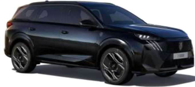
İnci Siyah 9VM0