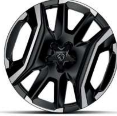
19" Elmas Kesim Jantlar LULEA

Allure & GT (Hybrid) versiyonlarında standart