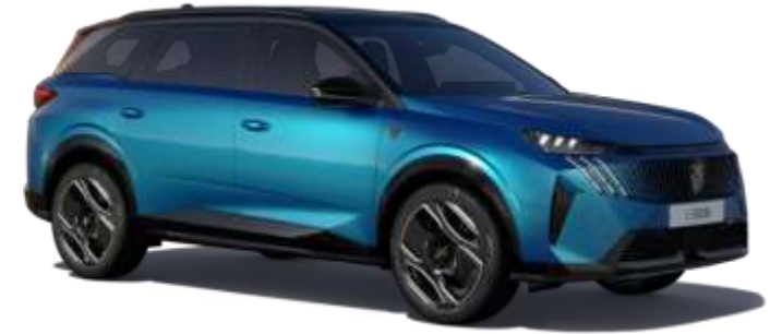
Obsession Mavi DPM0