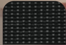
Curitiba Siyah Kumaş Döşeme CMFT-Siyah