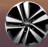
17'' Jant Kapakları