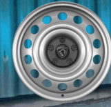
16" Jant Kapakları