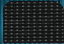
Curitiba Siyah Kumaş Döşeme CMFT-Siyah