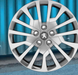
17" Jant Kapakları