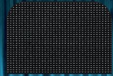
Meltem Kumaş Döşeme 43FT-Siyah