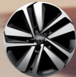
17" Jant Kapakları